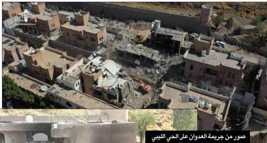
صور من جريمة العدوان على الحي الليبي

تأديبية للرعاع - الذين كانوا أقناناً لدى تيمور بن سعيد سلطان عُمان ، والذين يتسمون بـ «دولة الإمارات العربية المتحدة» والعروبة منهم بريئة كبراءة الذئب من دم بن يعقوب ، يقوم الإعلام الاستعماري والصهيوني بتحويل ما حدث ، تارة باسم جرائم حرب ارتكبت في مساحة دولة الإمارات العبرية - وأن اليمن هو مرتكبها - تشويهاً لصورة اليمن واليمنيين أمام أنظار عالم لا يسمع ولا يشاهد إلا ما تعرضه الترسانة الإعلامية الغربية ذات الأصل الاستعماري الصهيوني، الأكثر بغضاً وكراهية لأي حرية واستقلال يناضل من أجل تحقيقها أي شعب من الشعوب . إن ما تسمى بـ «دول النفط» عاجزة عن تحقيق متطلبات أسياها الاستعماريين في إخضاع اليمن وغيرها من محور المقاومة .