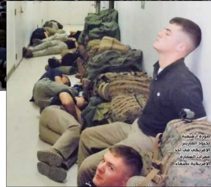
صورة أرشيفية لجنود المارينز الأمريكيين في أحد معسكرات السفارة الأمريكية بصنعاء

سرية وتجهيزات حساسة تم إتلافها التزاماً بالتدابير الوقائية المعمول بها".