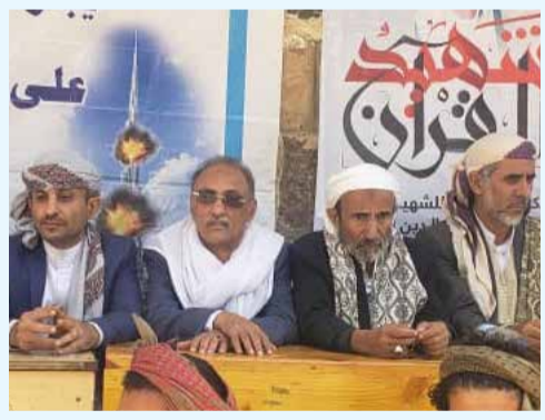
المجلس السياسي الأعلى.. وأشار الرفيق الأستاذ محمد الزبيري وزير الثروة السمكية * البقية ص 7

* الجماهير - ذمار: دشّن الرفيق الأستاذ محمد الزبيري القائم بأعمال الأمين القطري لحزبنا حزب البعث العربي الاشتراكي قطر اليمن وزير الثروة السمكية عضو اللجنة الرئاسية للتحشيد والاستنفار حملة إحصار اليمن للتحشيد والاستنفار للجبهات بمحافظة ذمار والمديرية التابعة لها..