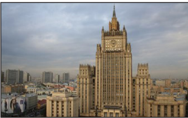
وواشنطن، لكن التعارض في المقاربات وتضارب الحجج لا يؤديان إلى تطوير هذا الحوار". وتابع: "رسل إشارات إلى الأميركيين، مفادها أن نهج تصعيدهم وخط تدخلهم في هذا الصراع أمرٌ محفوف بالعواقب الخيمة، والمخاطر تتزايد". من جهتها، أفادت وزارة الدفاع الأمريكية، أمس الإثنين، بأن "واشنطن تحتفظ بقنوات اتصال متعددة لمناقشة القضايا الأمنية الحرجة مع موسكو في حالات الطوارئ، من أجل منع الحسابات الخاطئة والحوادث العسكرية والتصعيد". وسبق أن صرح السفير الروسي لدى الولايات المتحدة، أناتولي أنطونوف، بأن الحوار السياسي بين روسيا والولايات المتحدة بلغ نقطة متدنية وغير مسبوقة، وأن التعاون بينهما انهار أيضاً، حتى في القضايا ذات الاهتمام المشترك.

أعلن نائب وزير الخارجية الروسي، سيرغي ريباكوف، اليوم الثلاثاء، أنه "لا يوجد حوار بين روسيا والولايات المتحدة فيما يتعلق بأوكرانيا، لكنهما يتبادلان الإشارات، بصورة دورية، بشأن ما يحدث في الصراع الأوكراني". وأشار ريباكوف إلى أن النهج الأمريكي في التصعيد في أوكرانيا "محفوف بعواقب وخيمة". وقال ريباكوف للصحافيين، رداً على سؤال عما إذا كانت توجد قناة منع الحوادث فيما يتعلق بما يحدث في أوكرانيا: "لا أعرف، على الإطلاق. ليس لدينا حوار مع الولايات المتحدة فيما يتعلق بالشأن الأوكراني، لأن المواقف متباينة جذرياً". وأضاف: "لدينا تبادل للإشارات من وقت إلى آخر بشأن تقبل إجراءات معينة لموسكو