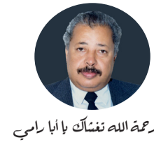
رحمة الله فنسك با أبا رامي