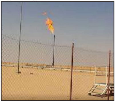
النفط اليمني الخام..

كشفت مصادر إعلامية عن صفقة بيع جديدة مشبوهة لقطاع نفطي هام في محافظة شبوة، جرى ترتيبها في ظروف غامضة من قبل قوى العدوان ومرترقتها.