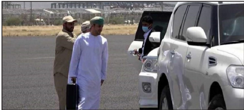
مبادرة من دول العدوان في التوصل إلى حل و سلام في اليمن. *الصدر: الميادين نت

تحقيق الإختراق المطلوب، في ظل استمرار تشدد الموقف الأمريكي، خصوصاً ما يتصل بمطلب صرف مرتبات الموظفين كافة، والذي ترفضه واشنطن بدعوى إمكانية إسهامه في تمويل الجهود الحربية لـ"أنصار الله". وبحسب مصادر مطلعة في صنعاء تحدثت إلى «الأخبار»، فإن الوفد العُماني حمل مقترحات من «التحالف»، لمعالجة قضية المرتبات على مرحلتين: يتم في أولها صرف معاشات المدنيين، وفي الثانية المحددة بستة أشهر دفع أجور العسكريين. كذلك، تضمنت المقترحات توسيع وجهات الرحلات الجوية من وإلى مطار صنعاء إلى خمس بدلاً من واحدة، وفتح عدد من طرقات مدينة تعز بالتزامن مع فتح الطرقات الرابطة بين المحافظات الواقعة تحت سيطرة الأطراف الموالية لـ"التحالف" وتلك الخاضعة لسيطرة صنعاء، إضافة إلى تخفيف القيود على