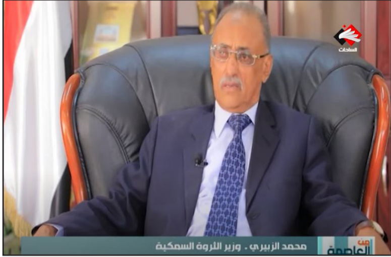
محمد الزبيرى - وزير الخارجية القطرية