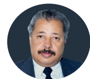
رعمة الله نفاك با أبا رامي