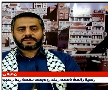
نصيب ر نصيب رالمشعة دفعه بعد رحمة بفضة به بع

الوضع في اليمن ستقبل الطاولة، والملف الإنساني في مقدمته صرف المرتبات وفقاً لميزانية النفط والغاز 2014، لا يزال أولوية لصنعاء في المفاوضات. وبشأن الجديد في وساطة الوفد العُماني، أشارت المصادر إلى "شبه موافقة على صرف المرتبات، لكن لعدد محدد من الموظفين". و ذكرت المصادر أن "الموافقة على صرف المرتبات تستتعي عدداً كبيراً من الموظفين اليمنيين، بينهم أبناء المؤسسات العسكرية والأمنية". وفي هذا الشأن، أكدت المصادر أن "صنعاء تتمسك بمطلبها صرف مرتبات جميع الموظفين اليمنيين في جميع المؤسسات الحكومية، انطلاقاً من أنه استحقاق إنساني لا يمكن التنازل عنه". وسبق أن أكد رئيس المجلس السياسي الأعلى في اليمن، مهدي المشاط، أنه "لا يمكن أن تكون هناك هدنة إذا لم يستجب الطرف الآخر لمطالب الشعب