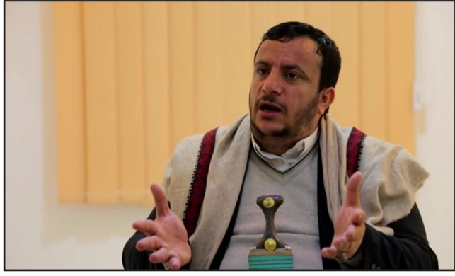
مبدئية من دول العدوان في التوصل إلى حل و سلام في اليمن.

وكان رئيس المجلس السياسي الأعلى في اليمن مهدي المشاط، أكد مراراً أنه "لا يمكن أن تكون هناك هدنة إذا لم يستجب الطرف الآخر لمطالب الشعب اليمني المحقة والعادلة، والمتمثلة في صرف مرتبات كل موظفي الدولة، وفتح جميع المطارات والموانئ". وبشأن اللقاءات التي عقدها وفد الوساطة العُمانية في صنعاء مع أعضاء الوفد المفاوض ومسؤولين حكوميين وقادة في حركة "أنصار الله"، وصفها رئيس وفد صنعاء المفاوض، محمد عبد السلام بأنها كانت "مثمرة". وقال نائب رئيس وفد صنعاء المفاوض، ونائب رئيس حكومة صنعاء لشؤون الدفاع والأمن، الفريق جلال الرويشان، إن "زيارة الوفد العماني