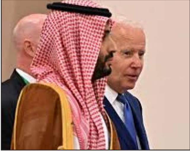
وأوضح أن محمد بن سلمان يسخر من ديمقراطية بايدن وخطاب حقوق الإنسان، كما أنه يضر بشدة بمصالح الولايات المتحدة.. ستندم إدارة بايدن على تفضيلها العودة إلى الأساسيات في الشرق الأوسط حيث تواصل الحكومة السعودية الاستفادة من موقفها المفرط.

ومن المرجح أن يجعل هذا والعهد أكثر تهوراً في المستقبل، وسيصبح من الصعب كبح جماح انتهاكاته. وتابع أن الولايات المتحدة تواجه قيادة سعودية متزايدة الخطورة وقمعية تعتقد أنها تستطيع تجاهل طلبات واشنطن بينما تحصل على دعم انعكاسي.. لذا السعودية هي مثال رئيسي على كيف أن تمكين الولايات المتحدة ينتج سلوكاً أسوأ وأكثر زعزعة للاستقرار. وتطرق إلى أن السعودية هي المسئولة عن الحرب التي تشنها منذ ما يقرب من ثماني سنوات ضد اليمن، حيث كانت وصمة عار مزعومة للاستقرار، وورطت الولايات المتحدة في جرائمها.. مضيفاً أنه لم يتوقع أحد أن بايدن يجعل السعودية دولة منبوذة، لكن تصميمه على التعامل مع العلاقة الأمريكية السعودية على أنها عمل كالمعتاد كان أحد أكبر الأخطاء التي ارتكبتها خلال العامين الماضيين.