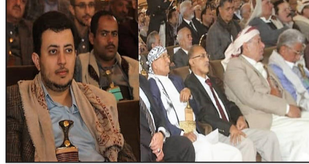
شارك الأمين القطري المساعد القائم بأعمال حزب البعث العربي الاشتراكي - قطر اليمن الأستاذ محمد محمد الزبيري، والشيخ رامي عبدالوهاب محمود عضو القيادة القطرية رئيس مكتب العلاقات الوطنية والخارجية للحزب في فعالية إحياء الذكرى العشرين لرحيل اللواء يحيى المتوكل الأمين العام المساعد الأسبق للمؤتمر الشعبي العام والتي نظمتها مؤسسة الشهيد يحيى المتوكل للتنمية والثقافة، بحضور رئيس مجلس النواب الشيخ يحيى علي الراعي، ورئيس الوزراء الدكتور