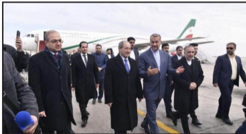
المجالس،" موضحاً أن البلدين يبحثان في كل اللقاءات التي

أكد وزير الخارجية في الجمهورية العربية السورية الدكتور فيصل المقداد أن العلاقات السورية الإيرانية استراتيجية، وستكفل خلال الأيام والأسابيع القليلة القادمة بجوانب تشهد على عمقها وعلى إيمان البلدين بضرورة تطويرها في مختلف المجالات، بما يخدم مصلحة الشعبين الصديقين. خلال مؤتمر صحفي أمس الثلاثاء مع نظيره الإيراني حسين أمير عبد اللهيان عقب مباحثاتهما في مبنى وزارة الخارجية، قال المقداد: "إن هذه الزيارة تأتي في ظل تطورات جديدة في المنطقة، حيث يواجه البلدان تحديات مستمرة من قبل الدول الغربية وفي مقدمتها الولايات المتحدة والكيان العنصري الصهيوني وعملاء هؤلاء الذين لا يريدون للشعب السوري أن يمر بمرحلة مريحة، مشيراً إلى أن هذه التحديات بالنسبة لإيران مستمرة منذ قيام الثورة الإسلامية عام 1979. وأضاف المقداد: "نتقدم بالشكر لإيران على تطوير علاقاتها مع سورية في مختلف المجالات السياسية والاقتصادية، ونؤكد على أن العلاقات بين بلدينا استراتيجية، وستكفل خلال الأيام والأسابيع القليلة القادمة بجوانب تشهد على عمقها وعلى إيمان حكومتي البلدين بضرورة تطويرها في مختلف