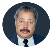
رعمة الله نغسك با انا رامي