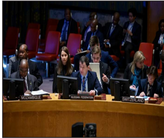
الحصول على النفط والغاز اليمني، ونعتبر هذا النهج الانتهازي الغربي خطيراً جداً، وضاراً بالسلام المستدام في اليمن".

شنت روسيا هجوماً عنيفاً على أمريكا، وبريطانيا، وفرنسا ووصفتهم بالانتهازيين في الحرب، التي يشنها التحالف بقيادة السعودية على اليمن للعام الثامن على التوالي، مؤكدة أن السلام في اليمن لن يتحقق إلا من خلال الحوار المباشر مع الحكومة اليمنية في (صنعاء).