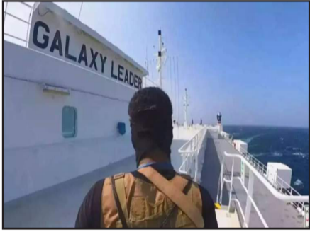
إلى موانئ فلسطين المحتلة.

الصحيفة تطرقت إلى أن قوات صنعاء قالت يوم الأربعاء إن اليمن "سيستمر في منع السفن الإسرائيلية أو المتوجهة إلى موانئ فلسطين المحتلة من الإبحار في البحرين الأحمر والعربي حتى إدخال الغذاء والدواء إلى الأشقاء في قطاع غزة". وذكرت أن القوات المسلحة اليمنية تؤكد أن أي عدوان أمريكي لن يمر دون رد أو عقاب... نحن نحذر العدو الأمريكي أو غيره من أي اعتداء أو عمل يمثل حماية للسفن التجارية التي تذهب إلى الكيان الصهيوني".