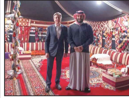
* محمد بن سلمان في لندن خلال زيارة للأمير السعودي قبل سنوات عدة.

التقى ولي العهد السعودي محمد بن سلمان، وزير الخارجية الأمريكي أنتوني بلينكن، في مدينة العُلا السعودية، وفيما أعلن الإعلام الرسمي للبلدين أن اللقاء كُرس لبحث وقف حرب "الكيان" على غزة، جاءت تقارير إعلامية لمراسلين مرافقين للوزير الأمريكي أن مواجهة عمليات القوات المسلحة اليمنية ضد الكيان الصهيوني وسفنه في البحر الأحمر وكذا استئناف مساعي التطبيع بين الرياض وتل أبيب أخذ الحيز الأكبر من الاجتماع الذي انعقد في مدينة العُلا السعودية قبيل مغادرة بلينكن إلى عاصمة كيان الاحتلال.