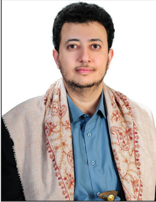
عضو القيادة القطرية لحزب البعث العربي الاشتراكي - رئيس مكتب العلاقات الوطنية والخارجية